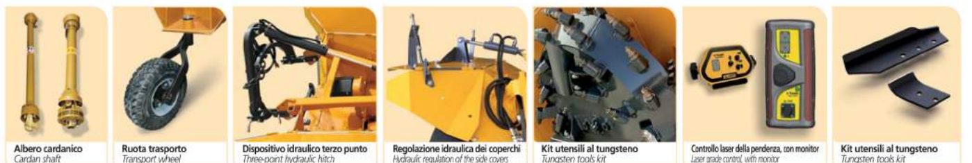
Albero cardanico Cardan shaft