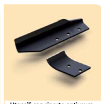
Utensili con riporto antiusura Long-life tools kit