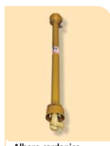
Albero cardanico Cardan shaft