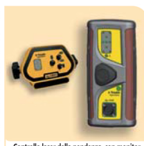
Controllo laser della pendenza, con monitor Laser grade control, with monitor