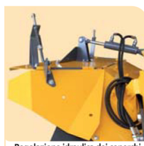
Regolazione idraulica dei coperchi Hydraulic regulation of the side covers