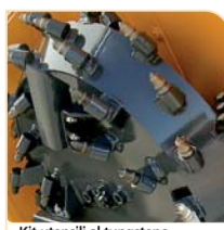
Kit utensili al tungsteno Tungsten tools kit