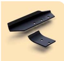
Utensili con riporto antiusura Long-life tools kit