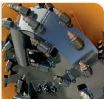
Kit utensili al tungsteno Tungsten tools kit